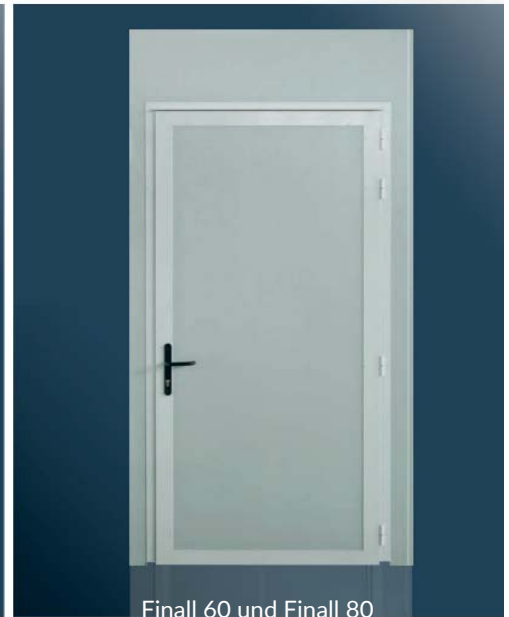
Finall 60 und Finall 80

System zur Herstellung von ein- oder zweiflügeligen Türpaneelen, mit Türflügel aus Paneelausschnitt.