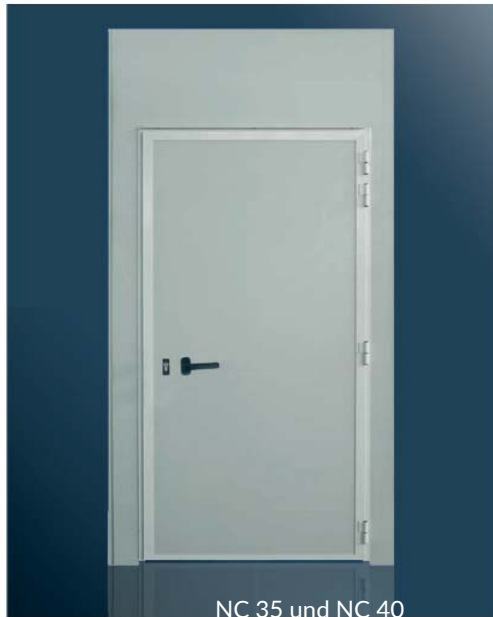
NC 35 und NC 40